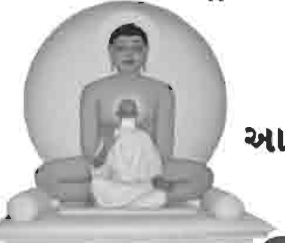
શ્રી અજરામર તીર્થ ધામ